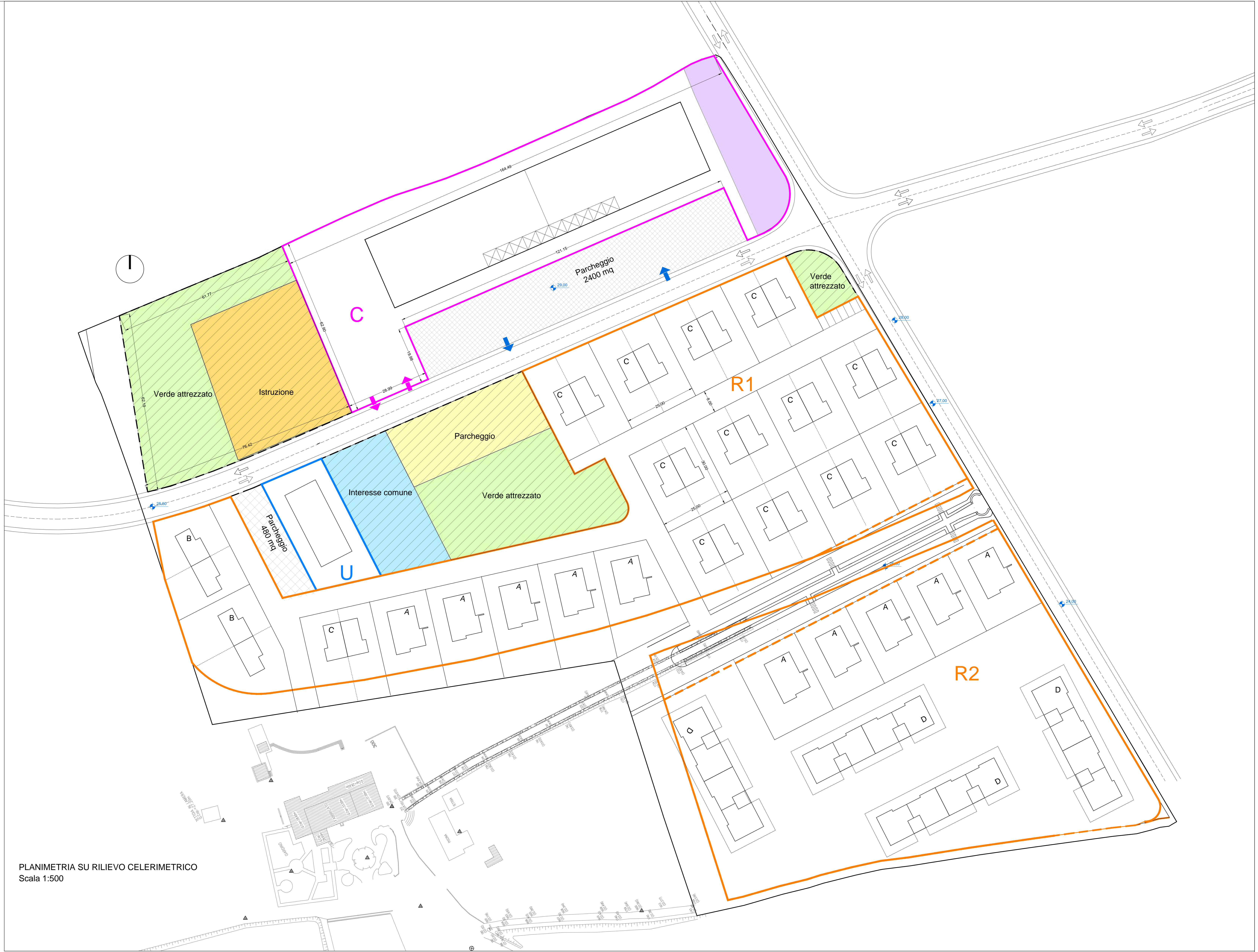
PLANIMETRIA SU RILIEVO CELERIMETRICO Scala 1:500

P5 PLANIMETRIA AREE ED OPERE DI URBANIZZAZIONE SECONDARIA Data: 30/07/2018 Scala: 1:500